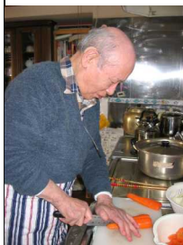
男子も がんばつて

午前中の健康チェックをしたら、楽しい談笑や体操、入浴など。食事の後、午後の憩いのひときは、各人の特技を生かした趣味のリラックスタイム。人形作り、ゲーム、野外散歩、カラオケなど楽しい交流で、部屋の中はいつも笑顔で一杯です。2月15日(木)はバレンタインほどの派手さはありませんが、チョコレートケーキの手作りを楽しみました